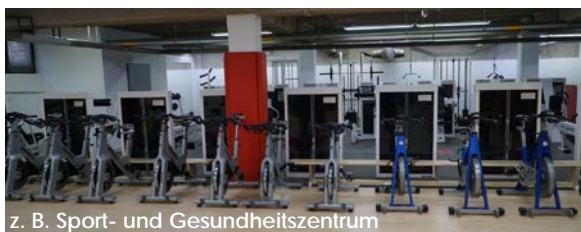
z. B. Sport- und Gesundheitszentrum