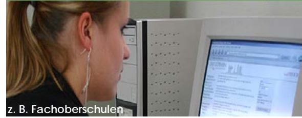
z. B. Fachoberschulen