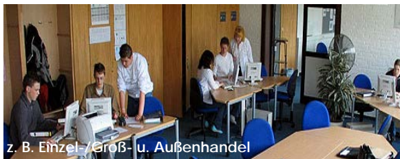
z. B. Einzel- / Groß- u. Außenhandel