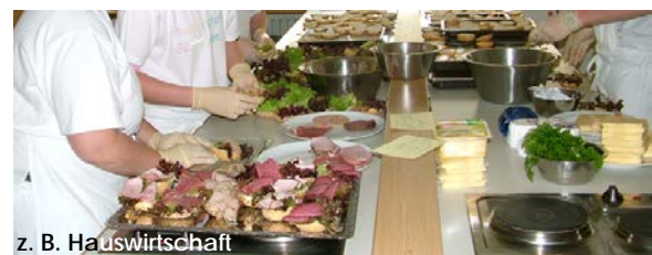
z. B. Hauswirtschaft