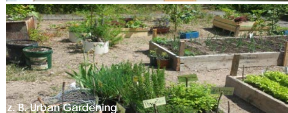
z. B. Urban Gardening

Bei uns erreichen Sie Berufsabschlüsse und Schulabschlüsse vom Hauptschulabschluss bis zur Fachhochschulreife.