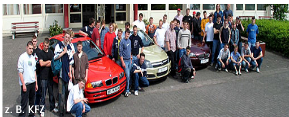
z. B. KFZ