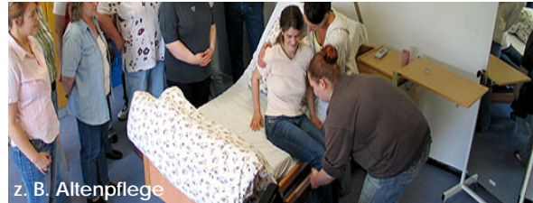
z. B. Altenpflege