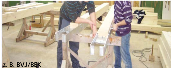
z. B. BVJ/BEK